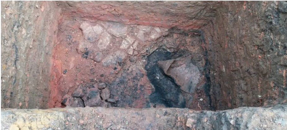
Slika 6. Sonda 4: Pločani kamen i amfora

Da bi dobili bolji uvid i proširili sliku lokaliteta, uz dozvolu vlasnika parcele, otvorena je i Sonda 4. Na dubini od oko pola metra ustanovljen je kulturni sloj sa kvalitetnijom keramikom, boljeg sastava i ljepših ukrasa. Ispod sloja humusa, otkrivena je keramika svjetlije, narandžaste boje. Na dubini od oko 1,5m pronađeni su tragovi gareži, ispod kojeg je bio deblji crvenkasti sloj pomiješan rastresitim kućnim ljepkom i keramikom. U zapadnom dijelu sonde, ispod sloja kućnog ljepka, ustanovljeni su uredno složeni kameni profili, koji su svojim izgledom podsjećali na podnice. U neposrednoj blizini podnice otkrivena je amfora većih dimenzija, koja se zbog rastresitosti zemlje, raspala. Kako je već došlo vrijeme da se radovi privedu kraju, sonda je zatvorena i ostavljena za buduća arheološka iskopavanja.