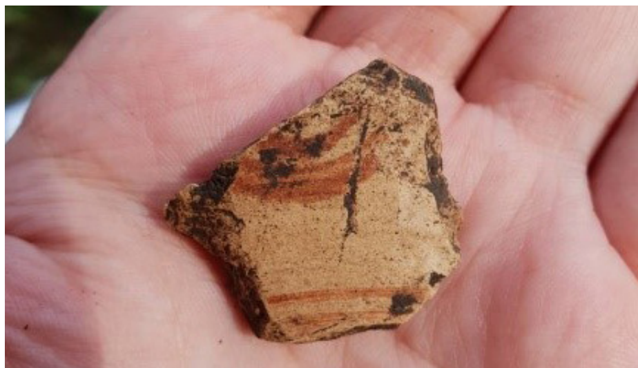
Slika 5. Fragment slikane keramike