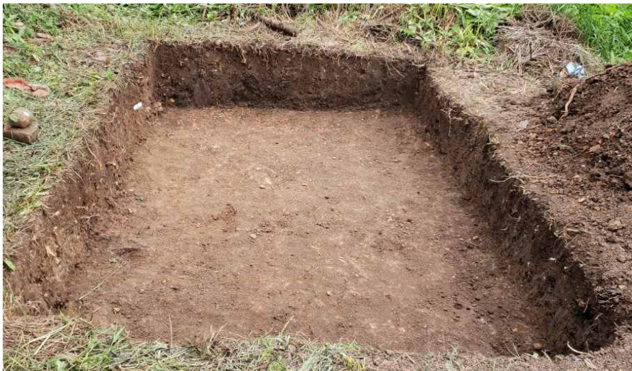
Slika 1. Sonda 3

Prvog dana arheološkog iskopavanja otvorene su: Sonda 1 i Sonda 2, te Sonda 3, paralelna sa Sondom 1 u pravcu istoka, malo većih dimenzija (3 x 2 metra). Međutim, zbog pojavljivanja predmeta iz moderne austrougarske gradnje u Sondi 2, te crvenkaste keramike, zajedno sa kućnim ljepljivom u Sondi 3, te su sonde iz praktičnih razloga ostavljene za neka dalja istraživanja.