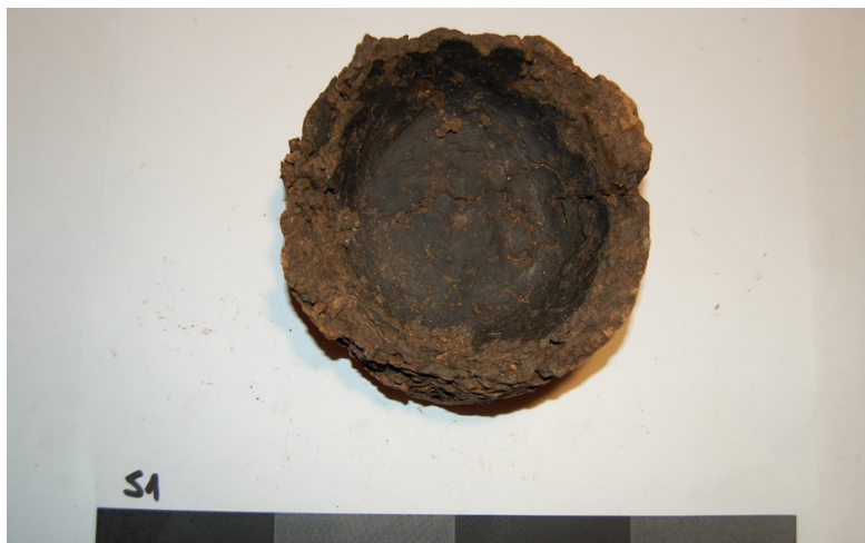
Slika 3. Sonda 1: Dno okrugle posude sa zidovima

Tokom iskopavanja u Sondi 1 pojavio se dubok kulturni sloj neolitske keramike, životinjskih kostiju, ali metalnih nalaza nije bilo. Pronađeno je dosta posudica, sa okruglim dnom, koje su se počele pojavljivati na dobini od 1.5m. Sonda je kopana do dubine od 2.4 metra gdje se došlo do zdavice.