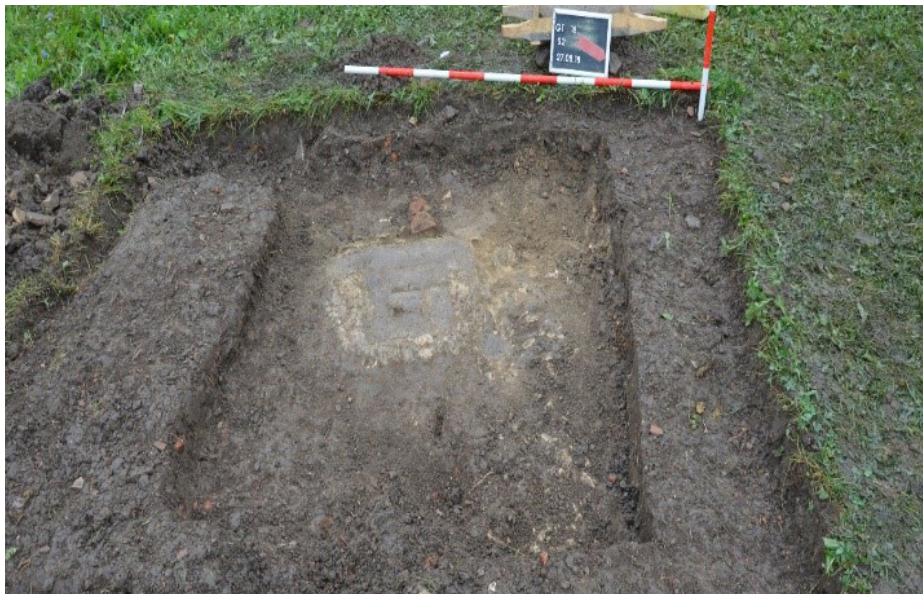
Slika 2. Austrougarski period

Tokom iskopavanja u Sondi 1 pojavio se dubok kulturni sloj neolitske keramike, životinjskih kostiju, ali metalnih nalaza nije bilo. Pronađeno je dosta posudica, sa okruglim dnom, koje su se počele pojavljivati na dobini od 1.5m. Sonda je kopana do dubine od 2.4 metra gdje se došlo do zdavice.